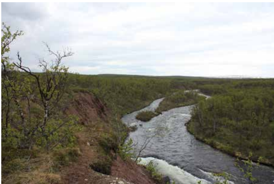
Suovvejoŋka, Unjárgga gieiddas / Bergebyelva, Nesseby kommune.

Alimusriekti lea guoddalanásahus meahcceduopmostuolo mearrádusaide.