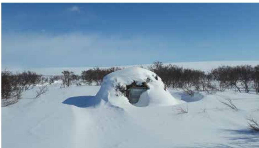
Goahti Álljeveajnjálmes, Čáhcesuolu gielddas / Gamme i Øvre Flintelvmunningen, Vadsø kommune

Meahcceduopmostuolu váldovuoruheapmi 2016s lei loahpahit buot áššiid mat bohte sisa duopmostullui. Dat lea dahkon juolluduvvon bušeahta rámaid siskkobealde. Meahcceduopmostuolu doaibmadilli lea mealgat buorránan maŋŋágo lahkaásahus § 9 nuppi láđas Finnmarkokomišuvnna ja meahcceduopmostuolu birra loahpahuuvui. Loahpaheapmi mearkkaša ahte gáibádus máksit áššegoluid mat ovddiduvvojit maŋŋá borgemánu 26.b. 2016s eai galgga máksot meahcceduopmostuolu bušeahtas, muhto galget meannuduvvot regelstivrema bokte seamma láhkai go golut friddja riekteveahkkái.