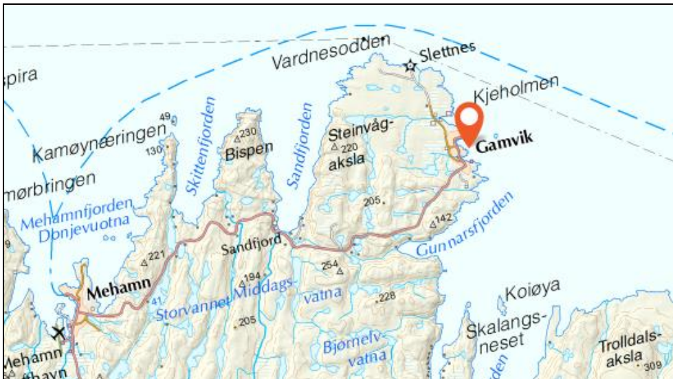
Figur 1. Planområdet, markert med oransje markør, ligger i og rundt havnebassenget i Gamvik, nordøst på Nordkinnhalvøya.