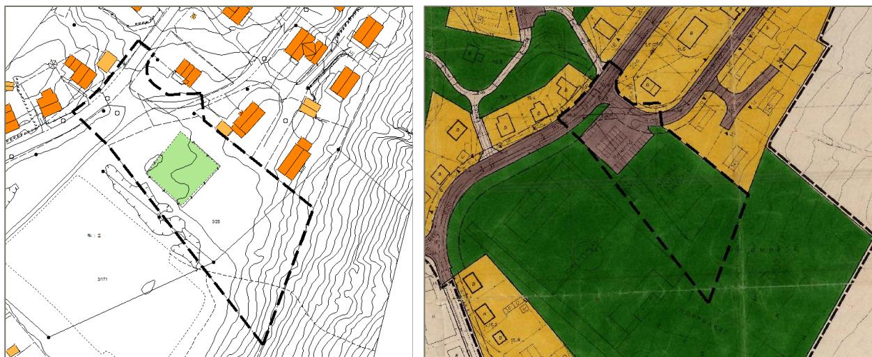
Figur 2. F.v.: Planavgrensning på grunnkart og gjeldende reguleringsplan

Planområdet som varsles ligger sentralt i Mehamn inntil boligområdet mot Vevika og idrettsplassen ved samfunnshuset. Planområdets avgrensning er vist i kartutsnittene under.